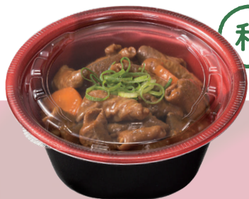
モツ煮込み赤味噌(約360g)