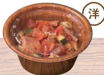
ミネストローネ(約360g)