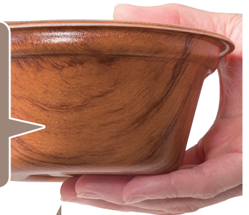
滑りにくい底面凸凹

※測定条件: 300gの水を入れ1600Wで55秒温め、水温が75~80°Cになったものを10秒後に測定