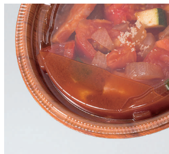
液漏れしにくい内嵌合