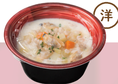
クラムチャウダー(約370g)