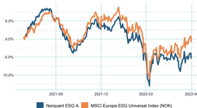
Utvikling NorQuant ESG

Dette brukes stadig mer innen fondsstrategier og investeringsrådgivning som et filter for å unngå uetiske selskaper, og kan også hjelpe med å identifisere sektorer og selskaper som er mer utsatt for finansiell risiko eller lavere forventet avkastning.