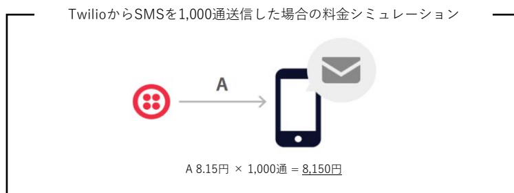
TwilioからSMSを1,000通送信した場合の料金シミュレーション