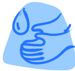
Wash your hands!