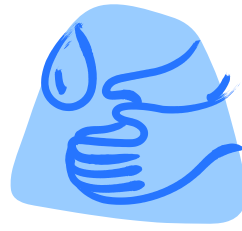
¡Lávese las manos!