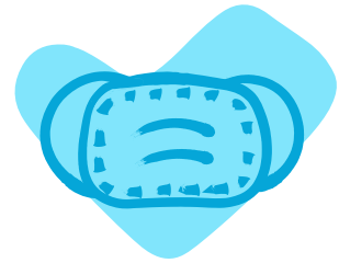
Use una mascarilla si tiene tos

Todas las personas mayores de 6 meses deben vacunarse contra la influenza. Obtenga la vacuna contra la influenza o el aerosol nasal en el consultorio de su pediatra, o en CVS, Walgreens u otra farmacia local (consulte los requisitos de edad). La vacuna contra la influenza es gratuita con la mayoría de los planes de seguro, incluido Medicaid. Pregúntele a su médico o farmacéutico para estar seguro.