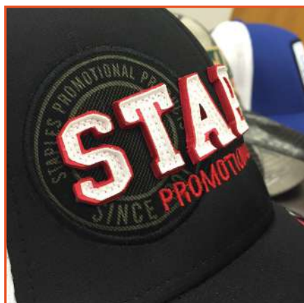
Applicazioni 3D 3D appliquè