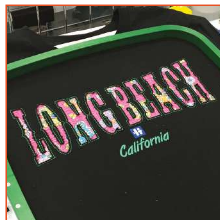
Applicazioni inverse Reverse appliquè