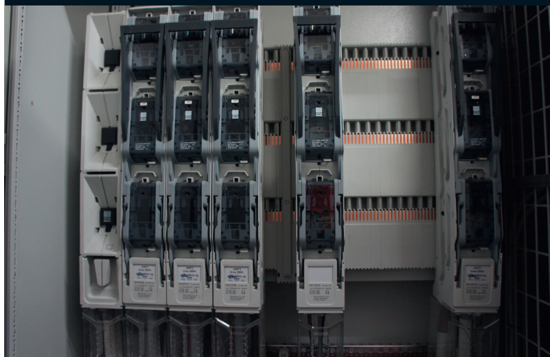
Grâce au nouveau 185mm 1600 A / 2b, l'adaptateur d'alimentation et les barres de commutateurs ont pu être intégrés rapidement.