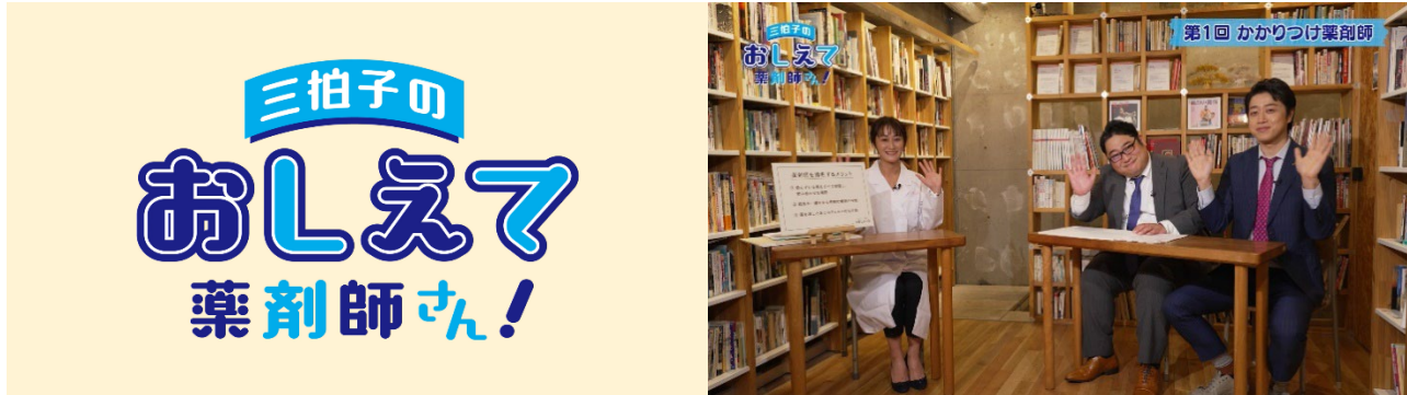
三拍子の「おしえて薬剤師さん！」のタイトルと番組のワンシーン

アイセイ薬局が2021年9月1日より運営している健康情報メディア『HELiCO』では、「あしたがちよっと健康に」をコンセプトに、“予防”を中心とした正しい情報をわかりやすく発信しています。「気軽に読める」「実践しやすい」コンテンツを提供することで、健康情報をもっと身近に感じてもらい、そのうち一つでもお試しいただくことで皆さんの「あしたがちよっと健康になったら」と考えています。