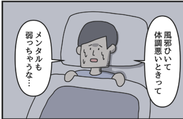
ジョンソンともゆきさんの連載漫画の1コマ

特徴① 40代前後の女性を中心に、多くの方に楽しんでいただける編成 40代前後は、自身や家族の健康を意識し始める年代です。一方、健康情報とは縁が薄かったため、ヘルスリテラシー（健康情報を入手し、理解して活用する力）の低い方が多いのも事実。そういった方々も敷居の高さを感じずに、気軽に読みながらヘルスリテラシー向上が期待できるコンテンツが充実しています。