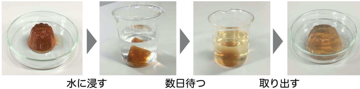
図1：水に浸した「こんにやくゼリー」が、水を吸って膨らむ様子。こんにやくゼリー、乾燥ワカメ、紙おむつの吸水剤などは、全て高分子のネットワークからできており、周囲の水を吸収して高分子の体積の何十倍も膨らむことができる。今回の研究では、ゼリーのようなゲルが膨らむ速度の温度変化を決める物理法則を明らかにした。