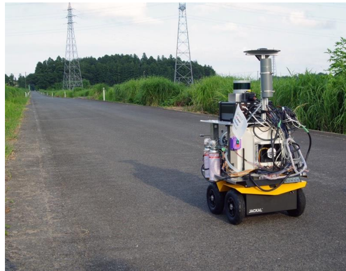
図：ロボット全体写真（上），および大熊町の帰還困難区域での走行時写真（下）