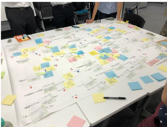
図：データジャケットを活用したデータ利活用方法検討ワークショップとアクションプランニングの様子

(2)上記の指標策定に当たって必要なデータの設計や分析手法を探索・選択するプロセスの開発とシナリオの生成を行う。